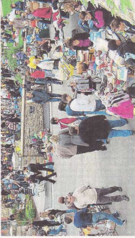
Le vide-greniers de Montigné-le-Brillant est l'un des plus importants du département.

Ce dimanche, il sera difficile de circuler dans les rues du village tellement les exposants et les chalandes seront nombreux.