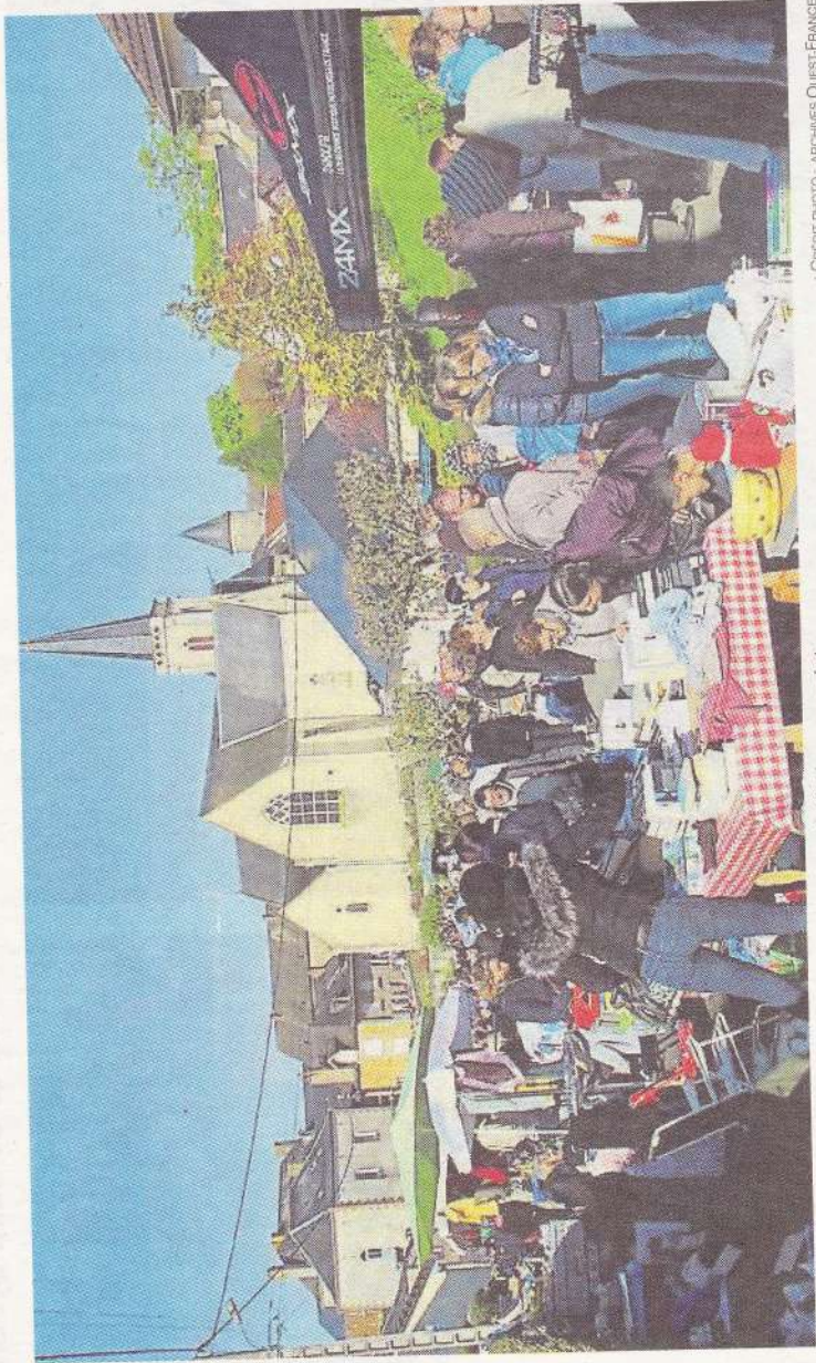
Le vide-greniers de Montigné-le-Brillant du 4 mai affiche complet.

Si bien que d'une seule rue, le vide-greniers passera à trois : la rue des Lauriers, la rue des Écoles et la rue Saint-Georges forment le triangle d'or. « Nous ne souhaitons pas agrandir. Nous le pourrions. Mais non », sourit le président.