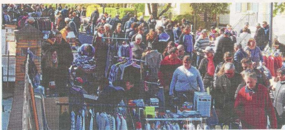
Les chineurs ont une nouvelle fois été nombreux à chercher la bonne affaire dans les rues de Montigné.