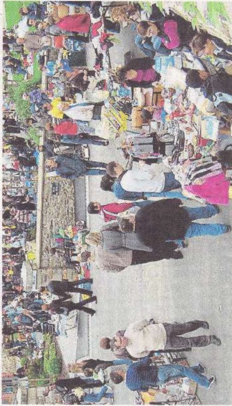
Le vide-greniers de Montigné-le-Brillant est l'un des plus importants du département.

Ce dimanche, il sera difficile de circuler dans les rues du village tellement les exposants et les chalandes seront nombreux.