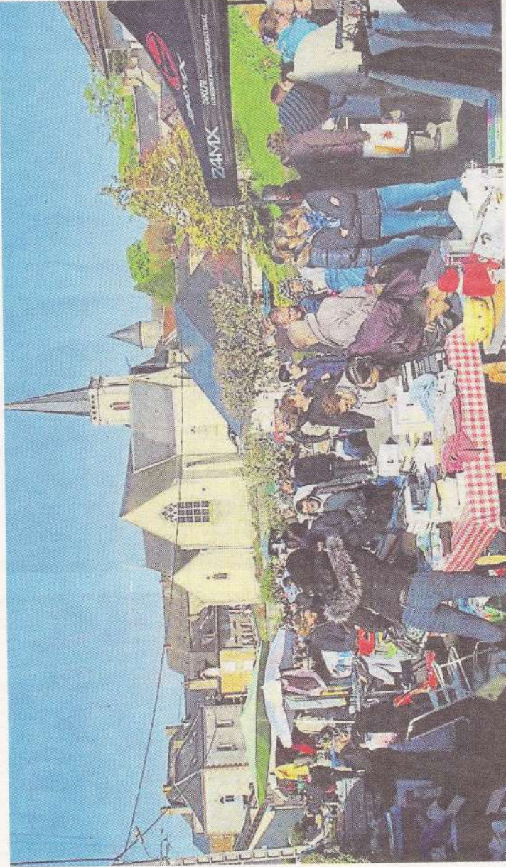
Le vide-greniers de Montigné-le-Brillant du 4 mai affiche complet.

Si bien que d'une seule rue, le vide-greniers passera à trois : la rue des Lauriers, la rue des Écoles et la rue Saint-Georges forment le triangle d'or. « Nous ne souhaitons pas agrandir. Nous le pourrions. Mais non », sourit le président.